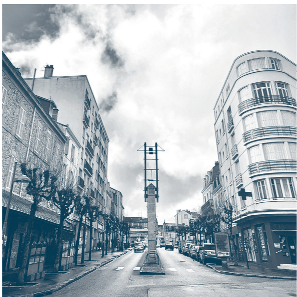
Prix du jury : L'avenue Théodore Bac par Gwen Sirieix.

généreusement offert par des commerçants du quartier : la poissonnerie Hall'Océan et la fromagerie Le Bois d'Amalée. Nous remercions ces deux commerces partenaires, situés en haut de l'avenue Garibaldi.